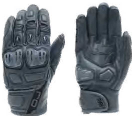
► BLACK/BLACK: S-2XL