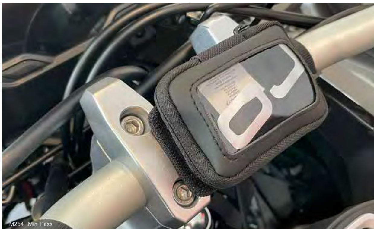
M254 - Mini Pass