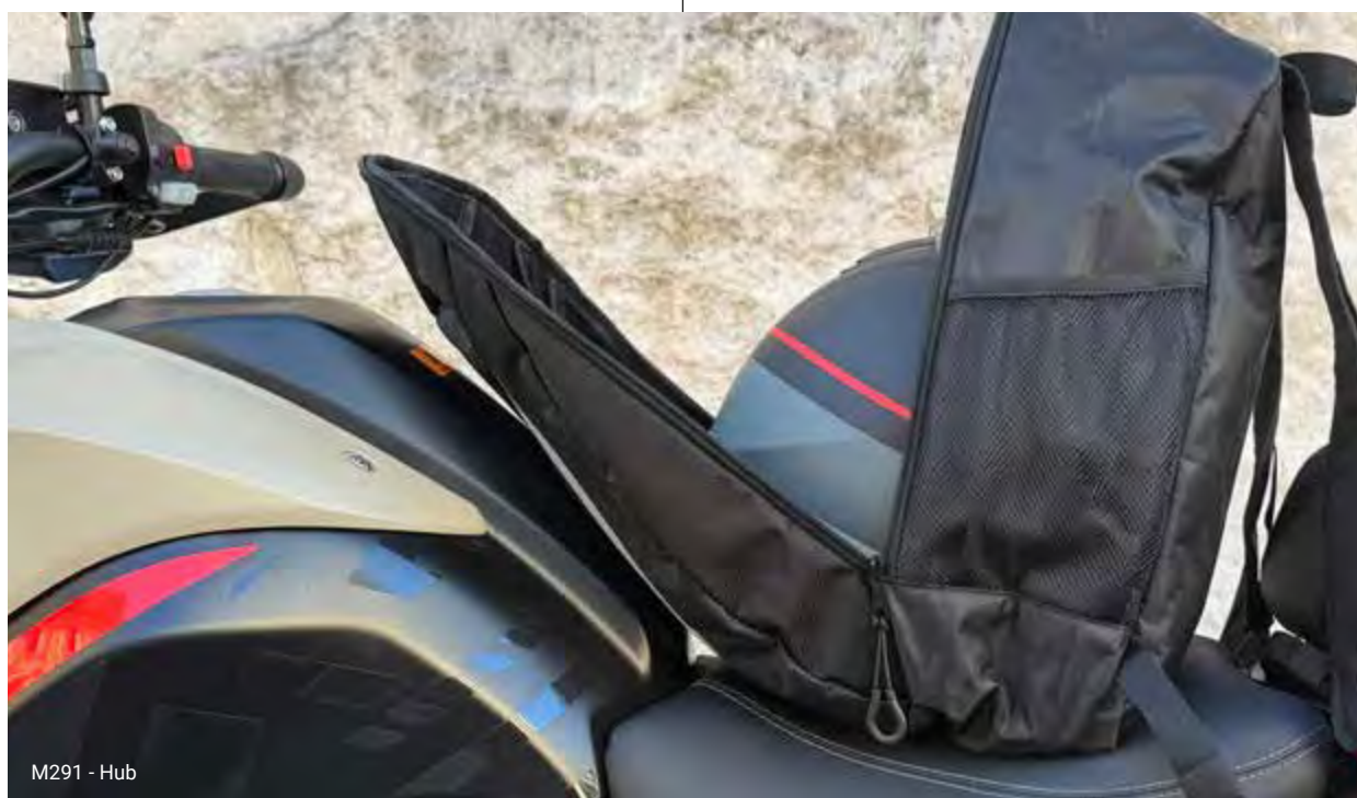
M291 - Hub