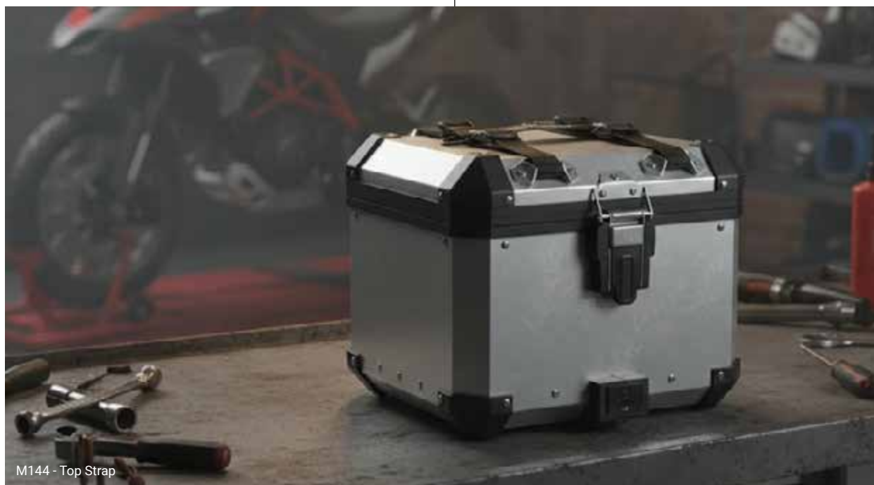
M144 - Top Strap