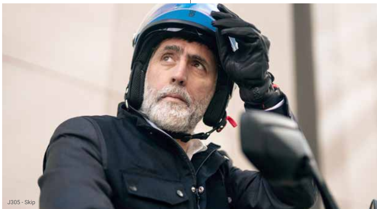
J305 - Skip