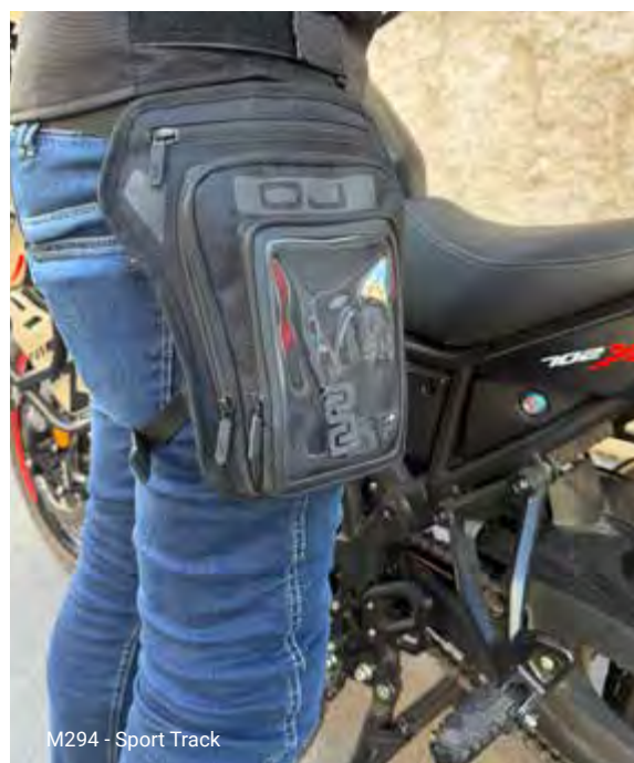
M294 - Sport Track