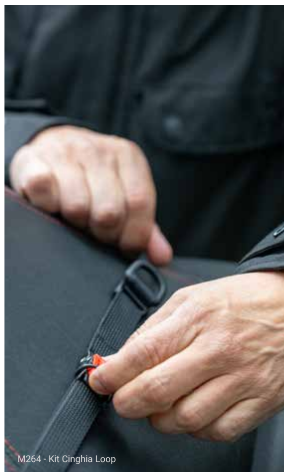
M264 - Kit Cinghia Loop