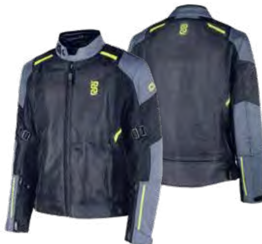
► BLACK/DARK GREY: S-5XL