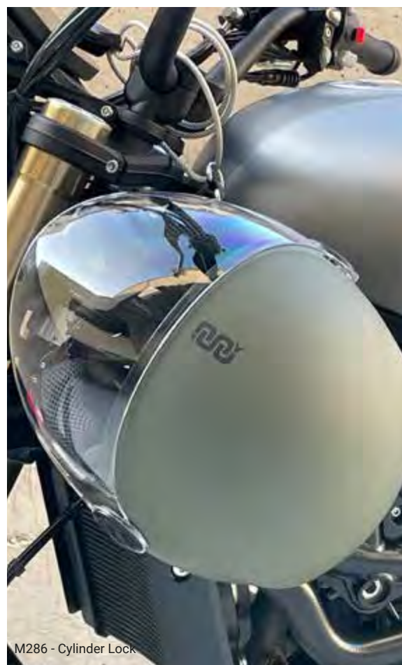
M286 - Cylinder Lock