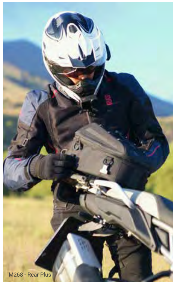
M268 - Rear Plus