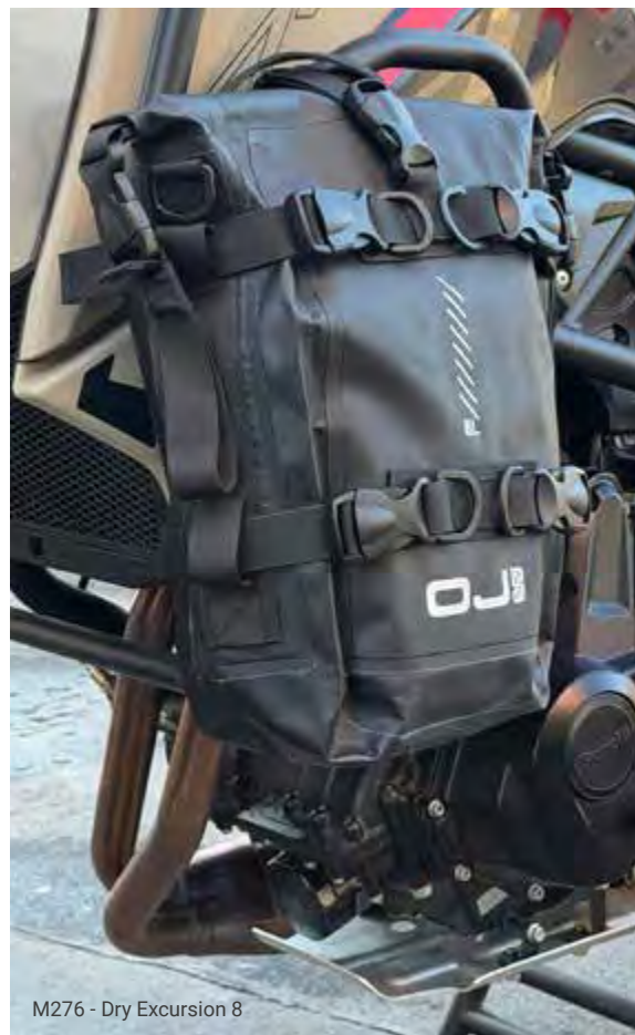
M276 - Dry Excursion 8