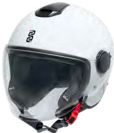
► WHITE: XS-XL