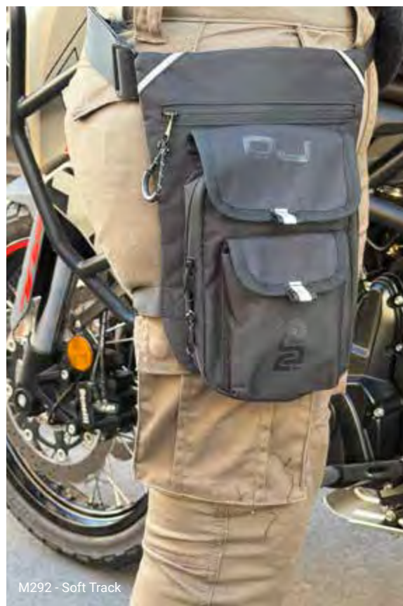
M292 - Soft Track