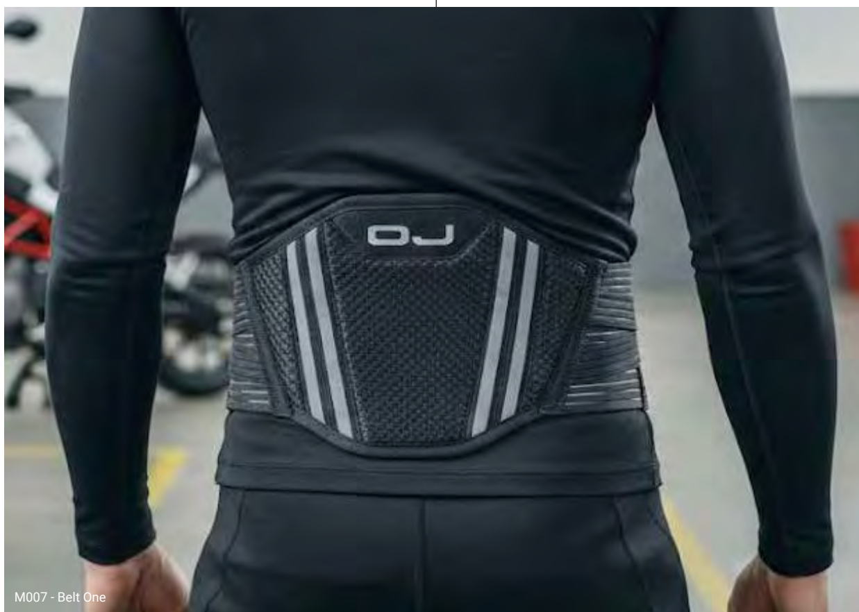
M007 - Belt One