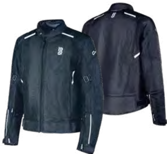
► BLACK: S-8XL