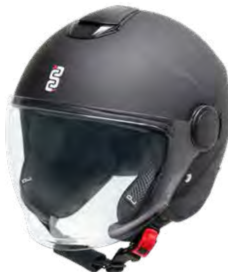
► MATT BLACK: XS-XL