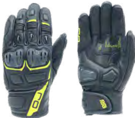
► BLACK/YELLOW FLUO: S-2XL