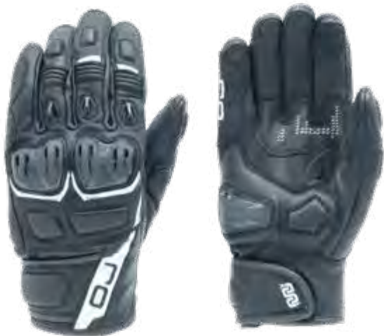
► BLACK/WHITE: S-2XL