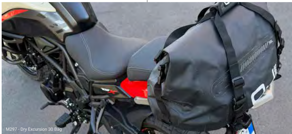
M297 - Dry Excursion 30 Bag