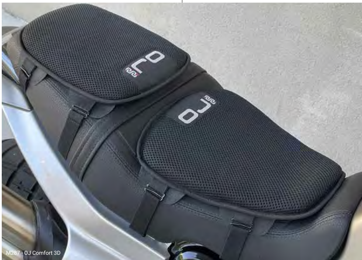
M287 - OJ Comfort 3D