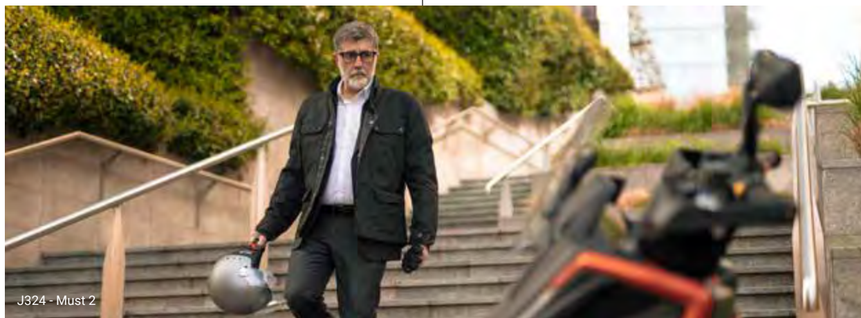
J324 - Must 2