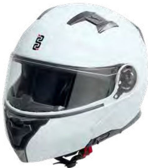
► WHITE: XS-XL