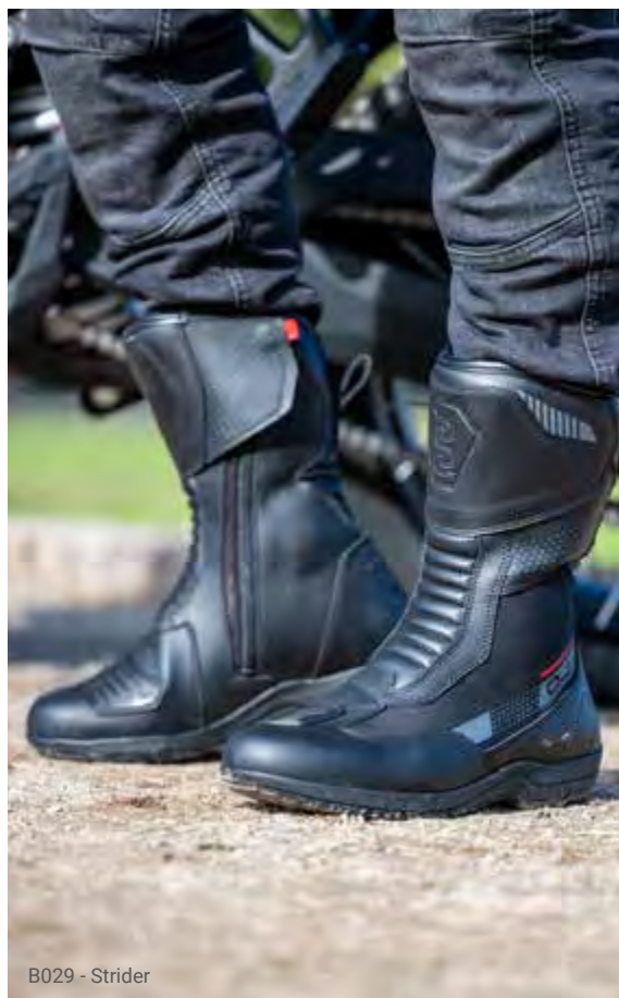
B029 - Strider