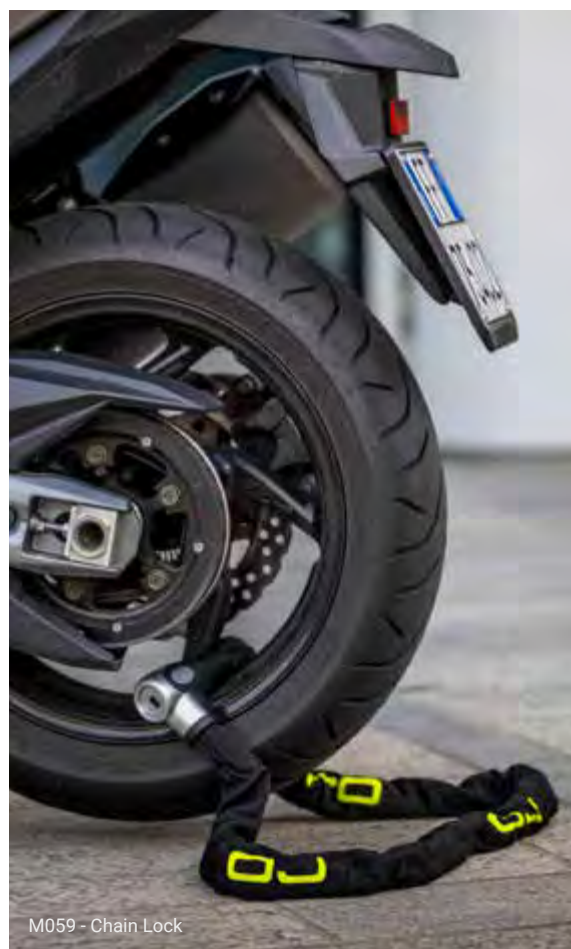
M059 - Chain Lock