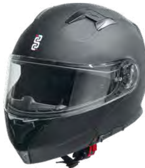
► MATT BLACK: XS-XL