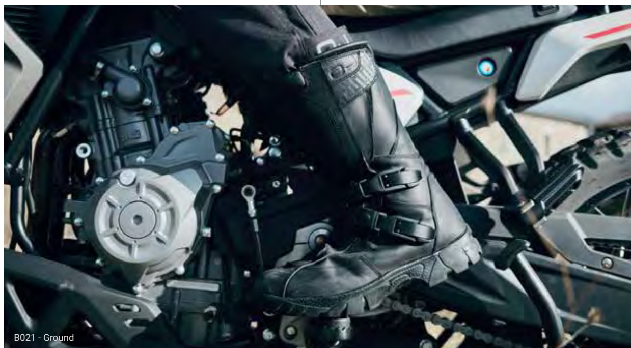
B021 - Ground